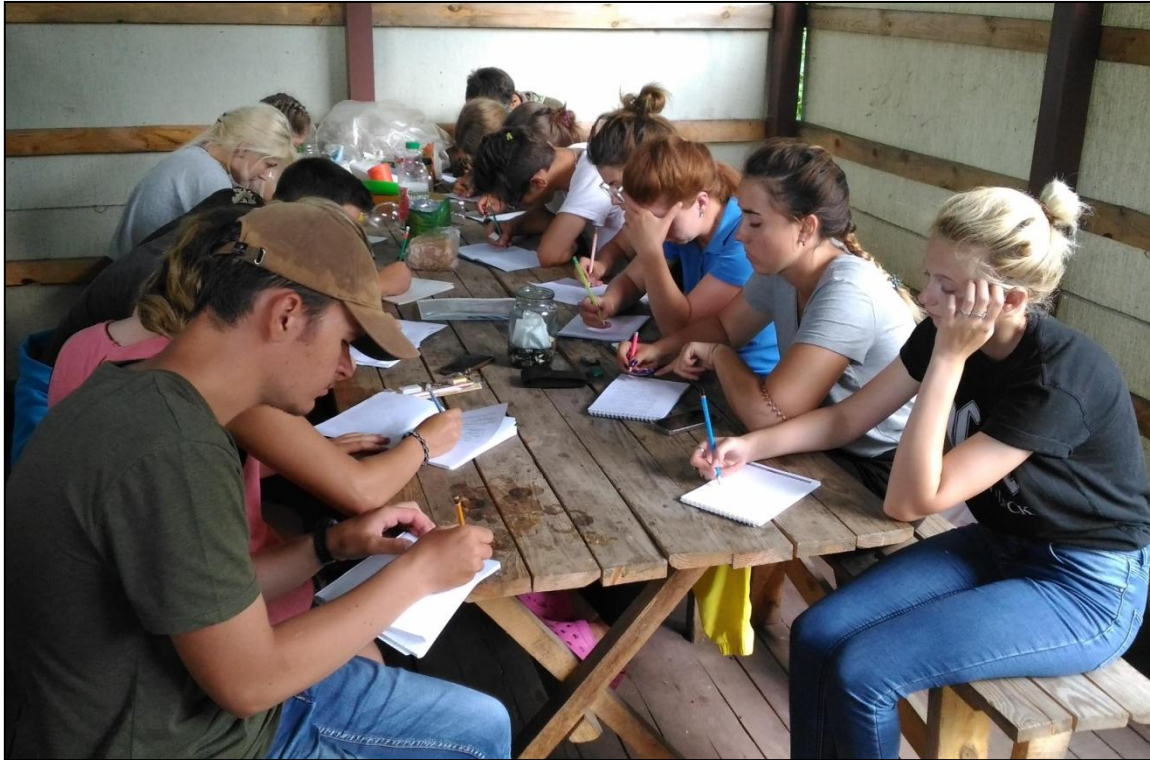
Идет лекция ...