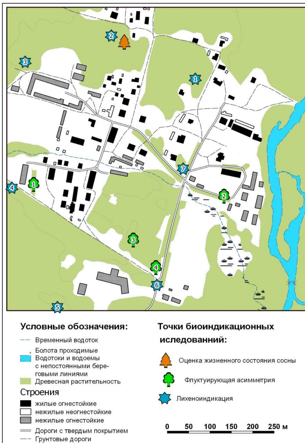
Общая карта биоиндикационных исследований, выполненных студентами на усадьбе Воронежского заповедника

анализ полевых и дистанционных данных позволил провести интерполяцию биоиндикационных показателей и оперативное картографирование типов растительности и её состояния для всего Усманского бора.