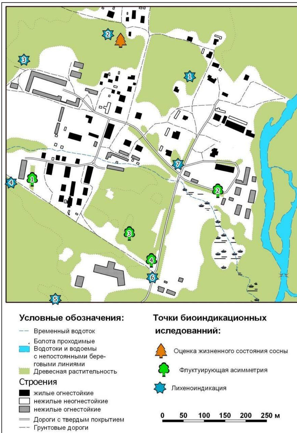
Карта ежегодных биоиндикационных исследований, выполненных студентами ГГиТ на усадьбе Воронежского заповедника