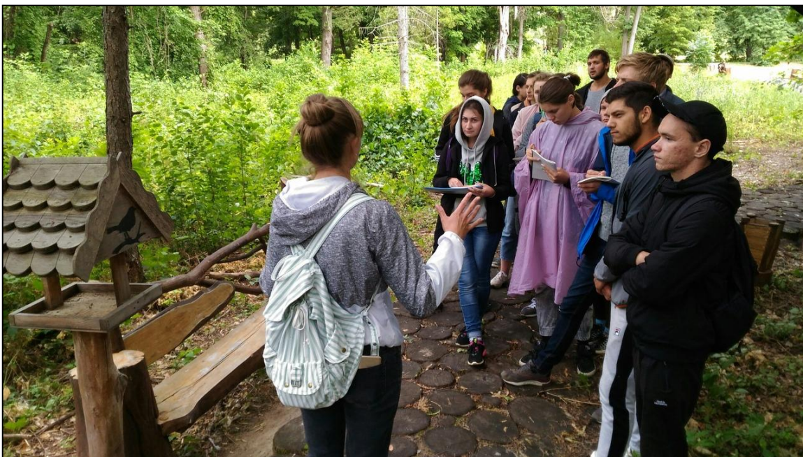
Полевая лекция ...