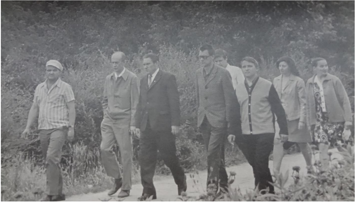
Выездное заседание секции экономгеографии НМС по географии при Минвузе СССР