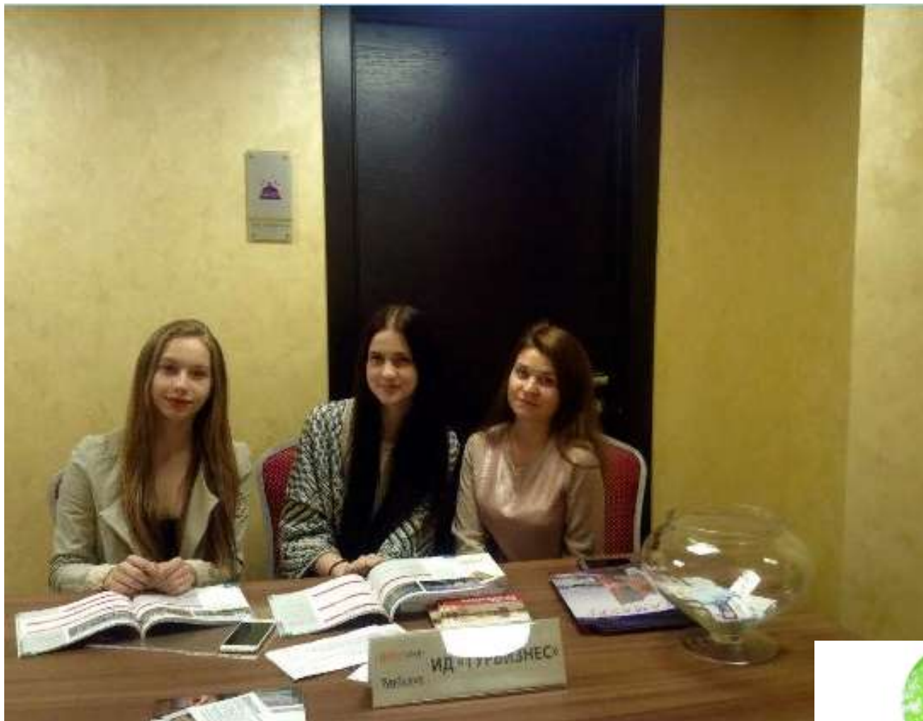
Волонтерская помощь издательскому дому «Турбизнес»