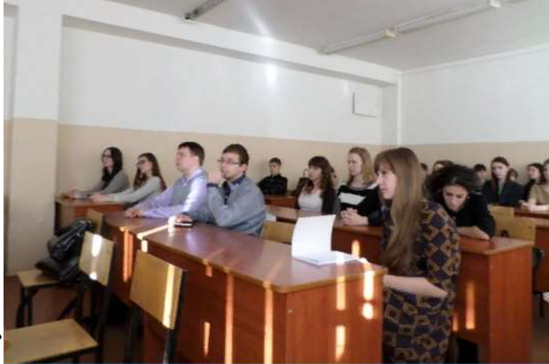
Заседание клуба «Люди и страны»