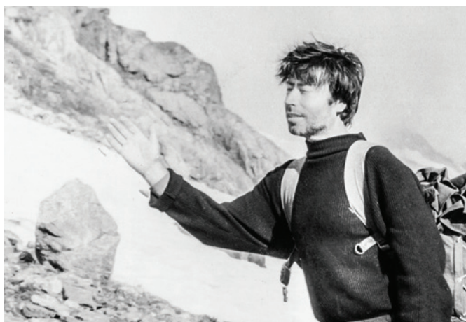
Вперёд – к Марухскому перевалу! (Кавказ, 1980 г.)

Не скромно говорить, но склоняюсь к тому, что впервые в нашей стране наиболее детально и с комплексных позиций были изучены карстово-меловые ландшафты европейской территории нашей страны