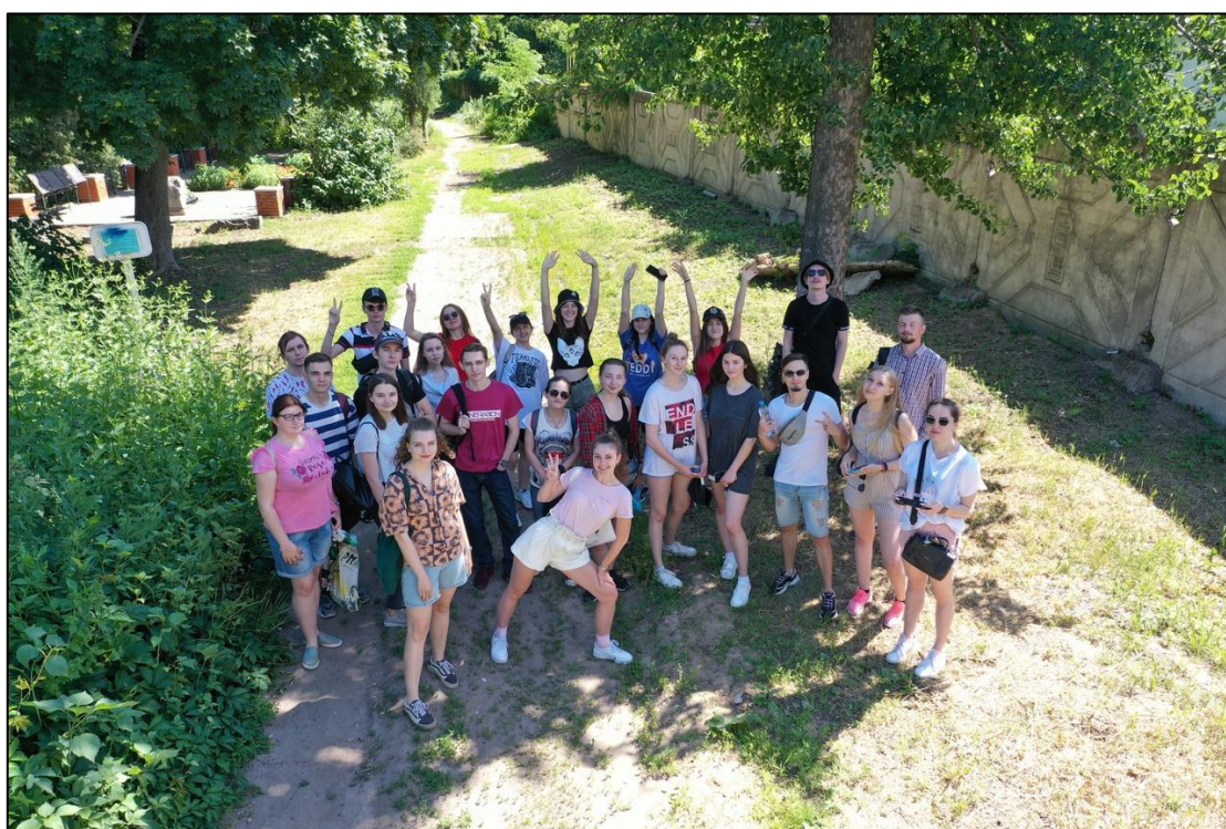
Во время экскурсии по Ботаническому саду ВГУ