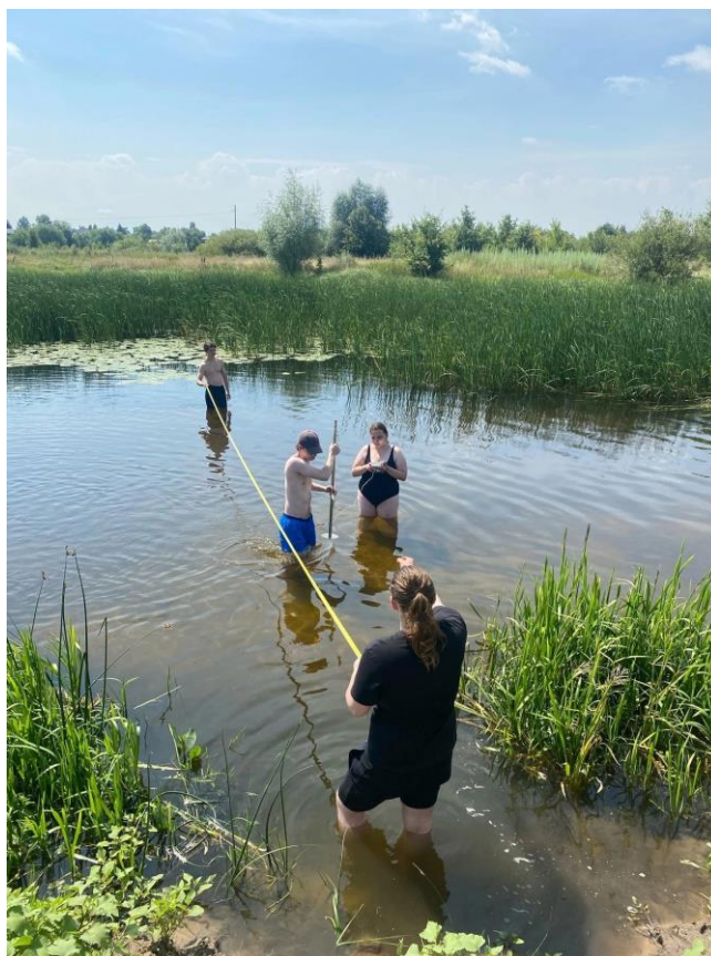
Измеряем расход воды, р. Усмань!