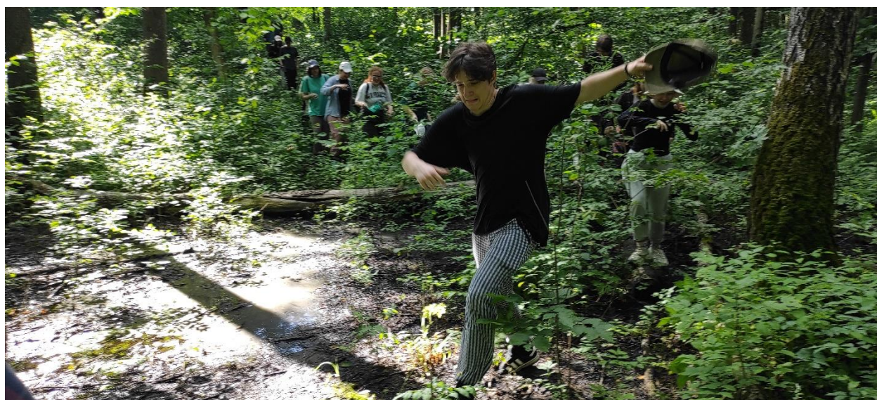
Комары нападают, а мы идём дальше.

Путь не был легким. Такие трудности как обильный ливень в первый день практики, колоссальные объемы сваренной гречки на ужины и влажные палатки не остановили студентов факультета Географии, геоэкологии и туризма на пути к знаниям. Посчастливилось пройти настоящее испытание: мы прошли тропы лесников заповедника, а также, сняв обувь и закатав одежду, пройти через болотную ряску.